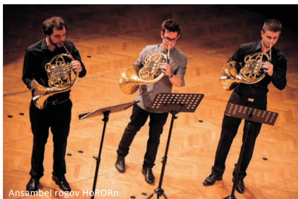
Ansambel rogov HoRORn

Navedite tudi želeni termin koncerta, kar bomo, v kolikor bodo dopuščale možnosti, tudi upoštevali. Zaželeno so še tehnične podrobnosti izvedbe vašega koncerta ter vsi potrebni podatki za pripravo pogodb.