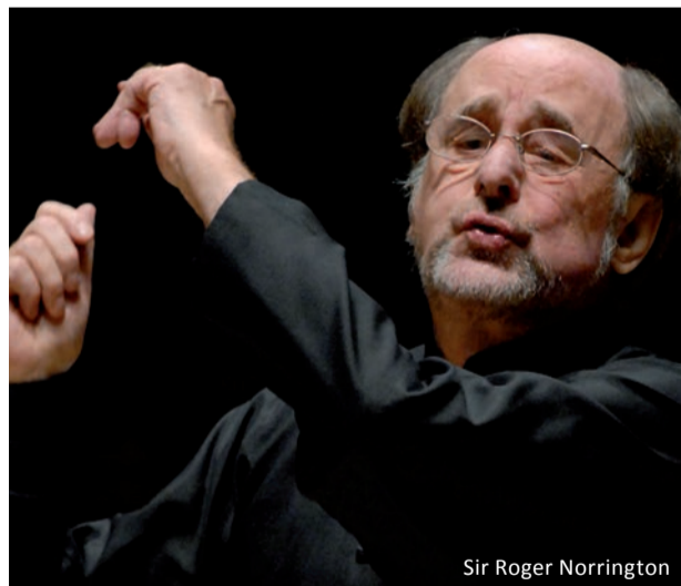
Sir Roger Norrington